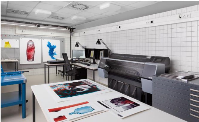
Christian Schmidt: Fotowerkstatt der Deutschen Fotothek, 2023, © Deutsche Fotothek/Christian Schmidt