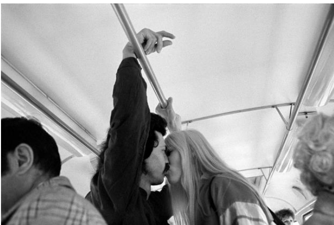
Mahmoud Dabdoub: In der Straßenbahnlinie 1, Leipzig, 1982/83, © Deutsche Fotothek/Mahmoud Dabdoub