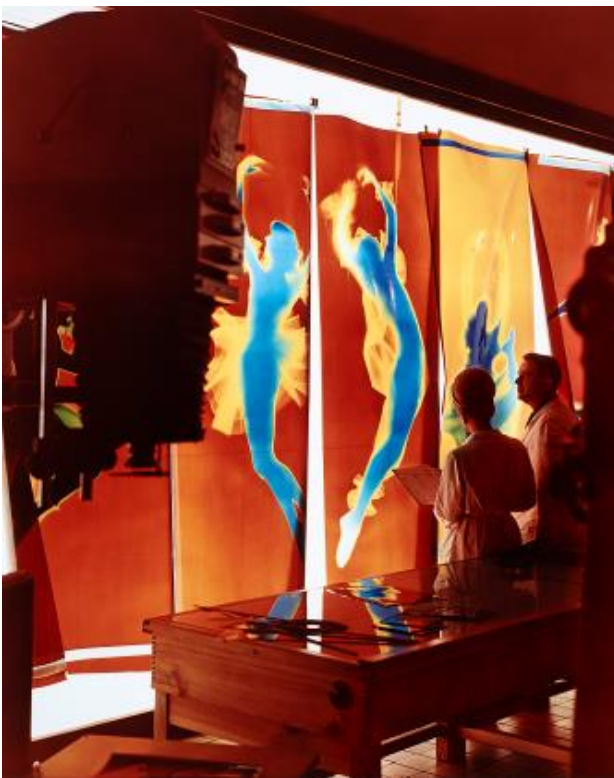
Wolfgang G. Schröter: Herstellung der Fotogramme von Harlekin und Colombine im Großdialabor für die photokina in Köln. Werbeaufnahme für die Marke ORWO des VEB Filmfabrik Wolfen, 1968, © Deutsche Fotothek/Wolfgang G. Schröter