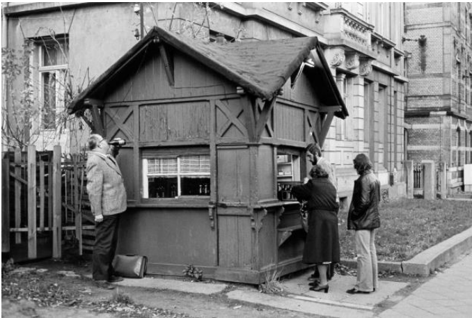
Christian Borchert: Kiosk, Kesselsdorfer Straße, Dresden-Löbtau, 1980, © Deutsche Fotothek/Christian Borchert