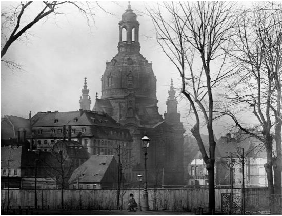
Ermenegildo Antonio Donadini: Die Frauenkirche in Dresden, 1887/88