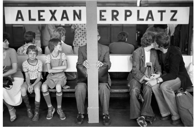
Rudi Meisel: Schönhauser Allee/Dimitroffstraße (heute Danziger Straße), Prenzlauer Berg, Berlin, DDR, 1984, © Deutsche Fotothek/Rudi Meisel