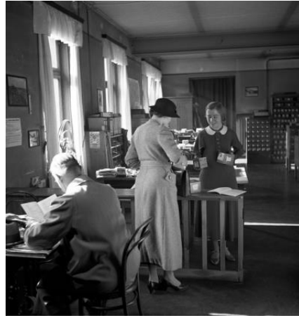
Walter Möbius: Benutzerin bei der Ausleihe von Lichtbildreihen in der Sächsischen Landesbildstelle, um 1937, © Deutsche Fotothek/Walter Möbius