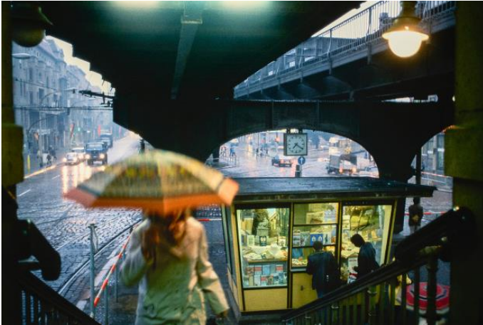
Rudi Meisel: S-Bahnsteig Alexanderplatz, Berlin-Mitte, DDR, 1980, © Deutsche Fotothek/ Rudi Meisel