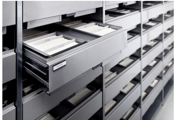
Christian Schmidt: Schrank im Negativarchiv der Deutschen Fotothek, 2023, © Deutsche Fotothek/Christian Schmidt