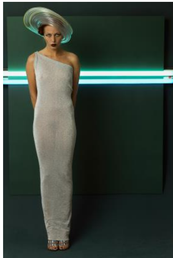
Ingolf Thiel: Neonhut. Aufnahme für Event, 1979, © Deutsche Fotothek/Ingolf Thiel