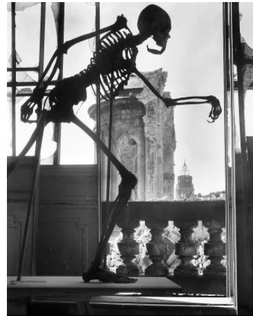
Richard Peter sen.: Tod über Dresden, Kunstakademie, Anatomiesaal, nach 1945, © Deutsche Fotothek/Richard Peter sen.