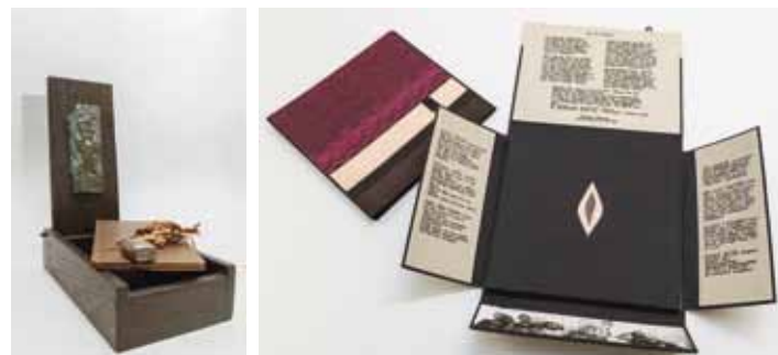
Die Künstlerbücher Tinius oder Die Bibliothek im Kopf (1998) und Mein Zahn riesengroß (1987), herausgegeben von Jörg Kowalski und Ulrich Tarlatt, edition augenweide

mit der Kuratorin am 8. April und 13. Mai 2022, jeweils 18.30 Uhr